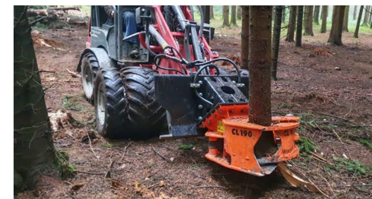
Woodcracker® CL schneidet weiches Holz bis zu 40cm.