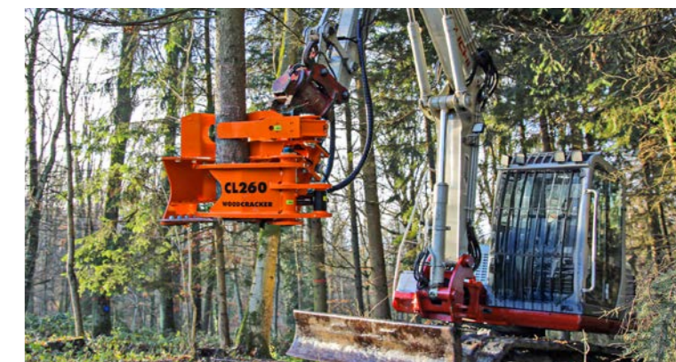
Optional auch mit Sammelgreifer.