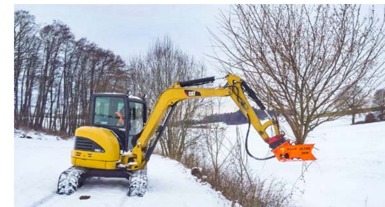
Für Minibagger ab 2,5t.