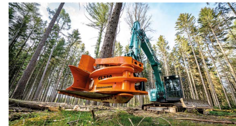
Schnelle Ernte von kleinen Bäumen.