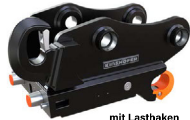
mit Lasthaken und Fallsicherung

Die hydraulischen KHS+ Schnellwechsler zeichnen sich durch einen sehr hohen Sicherheitsstandard aus. Die Fallsicherung (verlängerte Schnellwechsler-Klaue) verhindert ein Herunterfallen des Anbaugerätes wenn die Verriegelung des Schnellwechslers versehentlich nicht richtig geschlossen wurde. Um die Sicherheit noch weiter zu erhöhen, wurde der KHS+ Schnellwechsler zusätzlich mit zwei Sensoren ausgestattet, zur Unterstützung beim sicheren Verriegeln. Die KHS+ Wechsler erfüllen vollumfänglich alle geltenden nationalen und internationalen Normen und Vorschriften, so auch Maschinenrichtlinie 2006/42/EG, DIN EN 474-1, ISO13031 und SUVA.