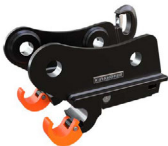
KHS21L+ hier mit Lasthaken

Lieferumfang: hydraulischer Schnellwechsler mit Fanghaken, KHS10-25L installation set sensor, KHS-L-Sensor