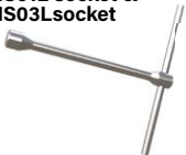
KMS01L socket & KMS03L socket