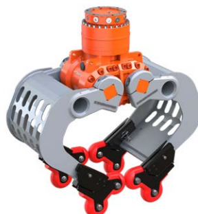
optionaler 4-Grip hier am D04HPX