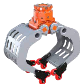
optionale 4-Grip Ansteckvorrichtung mit D09HPX